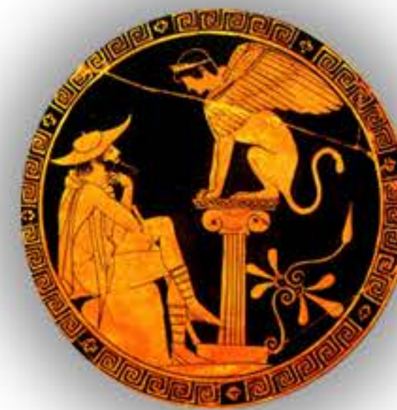
Дизајн и текст на памфлетот: Ненад Начковски

Што ќе изучувам ако го изберам предметот класичната култура во европската цивилизација?